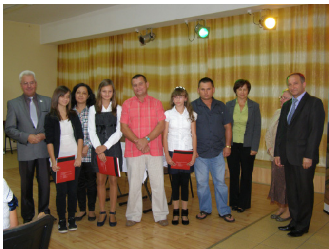
SP Warta Bolesławiecka