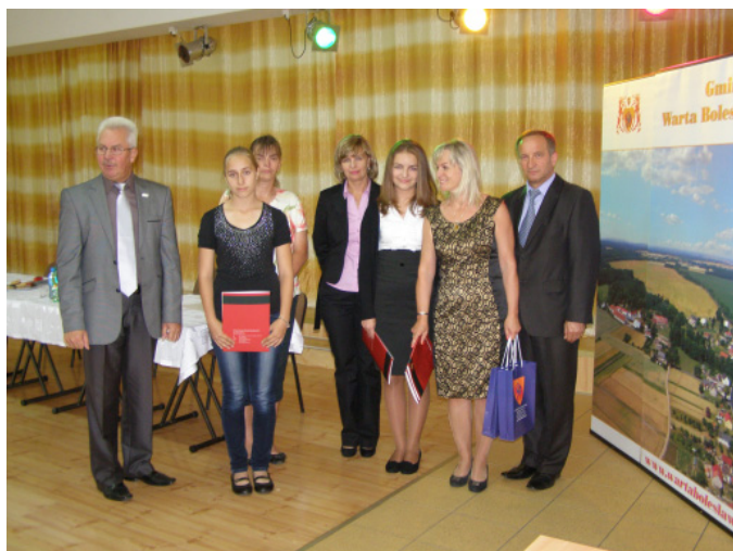
SP Raciborowice Dolne