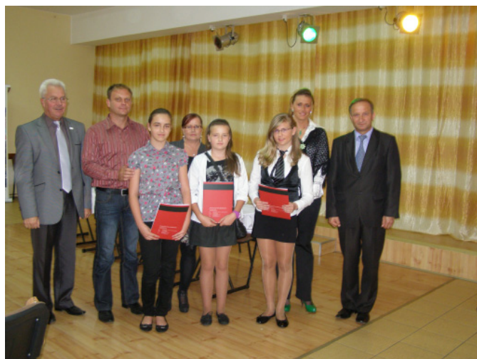
SP Tomaszów Bolesławiecki