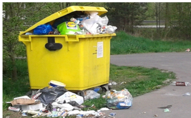
Przykłady niewłaściwej segregacji odpadów przez mieszkańców budynków wielolokalowych